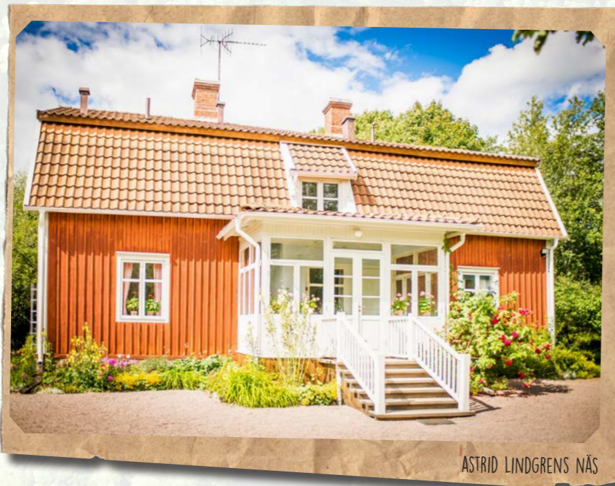
ASTRID LINDGREN'S NÄS

Astrid Lindgrens berättelser är fyllda med detaljer och historier från platser och personer som varit en del av hennes liv i Vimmerby. Båtmansbacken med sina små gatstensklädda gator, blommande trädgårdar och backiga gränder som liknar staden Lillköping där detektivböckerna om Kalle Blomkvist utspelas. Den tidigare specerieraffären i gula lilla huset på Storgatan som kom att utvecklas till den affär där Pippi Långstrump stövlade in för att köpa arton kilo karameller. Klemens gränds kullerstensklädda gränd precis intill Astrids första arbete på Wimmerby Tidning som fick bli kuliss vid scenen när Emil i Lönneberga kommer t från doktorn efter att ha fastnat med huvudet i soppskålen. Bra för att nämna några betydelsefulla plaster bara en stenkast från Vimmerby Torg.